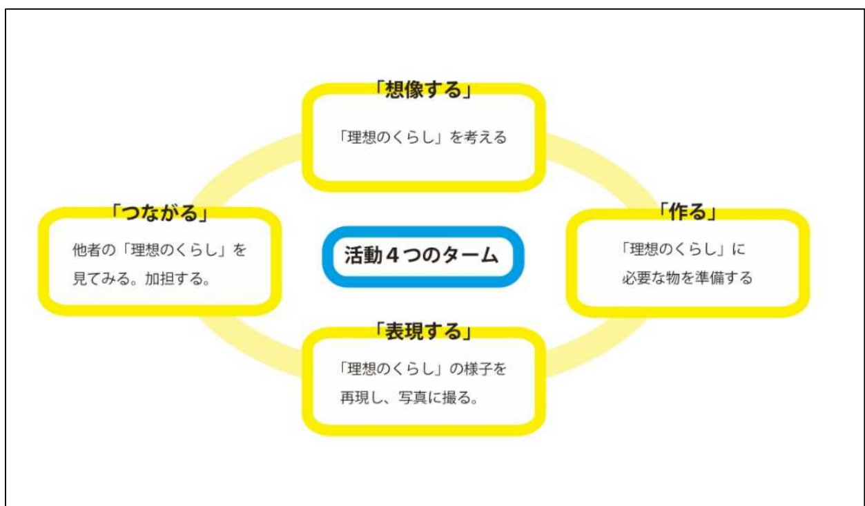
ワークショップで取り組む「活動の4つのターム」

美術大学を中心とした大学生のスタッフが参加者をサポートする他、参加者の中からもボランティアスタッフを募集し、プロジェクトを継続させていく場や関係そのものも参加者と共に構築していきます。ショッピングモールとそこへ訪れる人の新たなあり方を提示するユニークな試みに是非、ご注目ください。