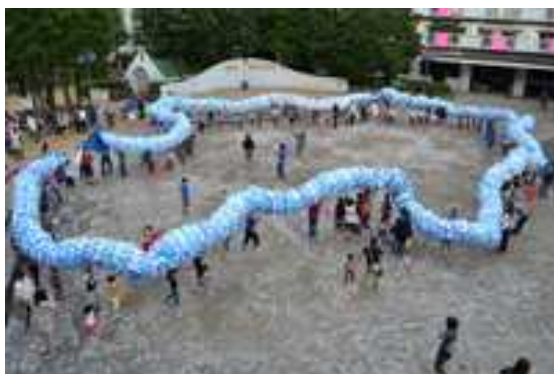
WAKABADAI SKY DRAGON (2011)