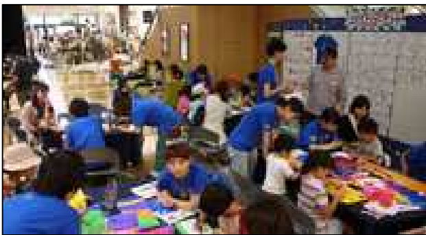
昨年のワークショップの様子

7月20日(土)から、株式会社ワールドが東京都武蔵村山市にあるイオンモールむさし村山に出店するライフスタイルストア「フラクサス武蔵村山」において、参加者とともに「理想の暮らし」を考える家をつくるワークショップ形式のプロジェクト“MUSASHIMURAYAMA MALL HOUSE（むさし村山モールハウス）”を開催します。