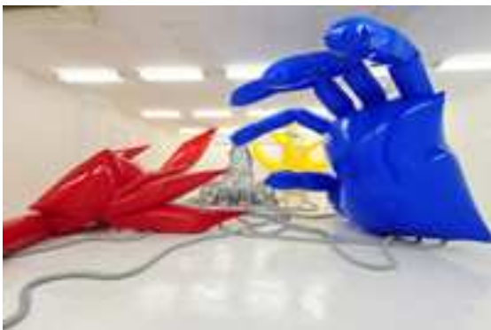
God bless me (2009)